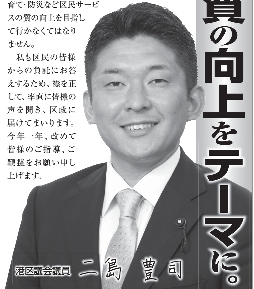
港区議会議員 二島 豊司

私も区民の皆様からの負託にお答えするため、襟を正して、率直に皆様の声を聞き、区政に届けてまいります。今年一年、改めて皆様のご指導、ご鞭撻をお願い申し上げます。